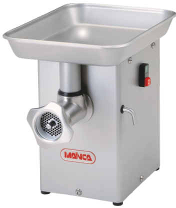
PM-70 / PM-12