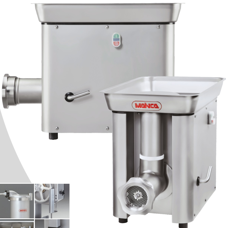
PC-98 / PC-32 PC-114