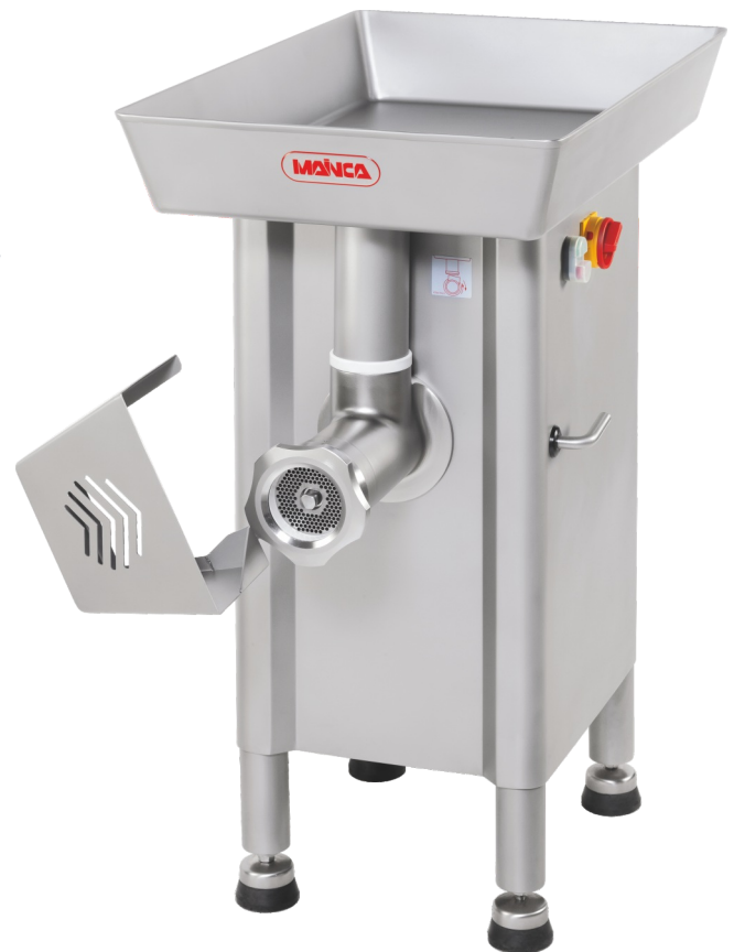
PC-98L / PC-32L PC-114L